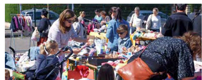
Bourse enfantine à Villard-Benoît