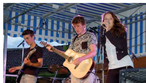
L'énergie du rock charrapontain