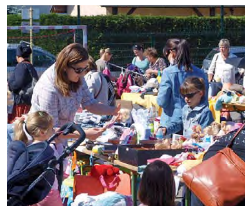
Le succès de la bourse enfantine à Villard-Benoît, le 24 mai