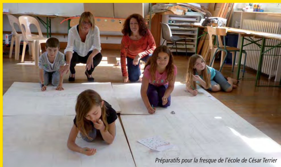
Préparatifs pour la fresque de l'école de César Terrier