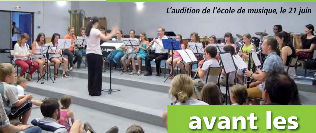
L'audition de l'école de musique, le 21 juin