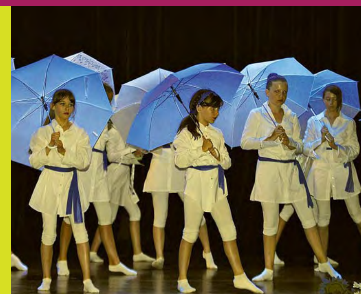
Des scènes pleines de rêves en bleu, lors du gala d'Acti Danse

* Acti Danse : contact pour les préinscriptions 2014-2015 : nathaliedanse@orange.fr