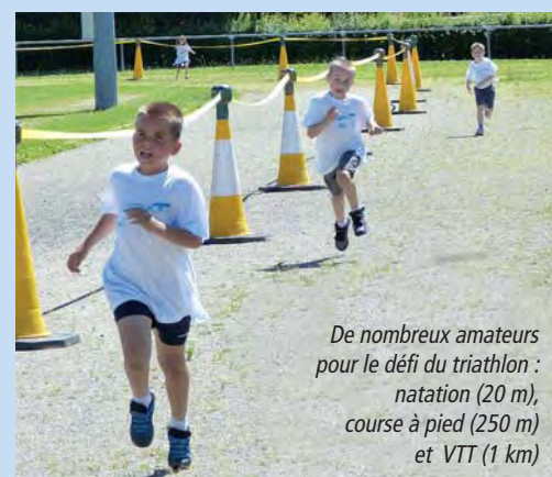
De nombreux amateurs pour le défi du triathlon : natation (20 m), course à pied (250 m) et VTT (1 km)

Le 25 mai, le stade avenue de la Gare a accueilli les Kids FITDays pour sa deuxième édition à Pontcharra. L'objectif de ce village sportif itinérant est de sensibiliser les 5-12 ans aux bienfaits du sport, aux règles d'hygiène de vie, ainsi qu'à l'esprit d'équipe et à la citoyenneté. Sous un beau soleil, les enfants ont pu profiter des animations et exercices sportifs qui leur étaient proposés : triathlon, ateliers ludiques (environnement et tri des déchets, nutrition, l'esprit d'équipe), initiation aux gestes de premiers secours avec les sapeurs-pompiers de Pontcharra, apprentissage de la circulation sous l'œil bienveillant des gendarmes... À l'issue de la journée, quatorze enfants ont été sélectionnés pour la finale régionale à Villard-de-Lans.