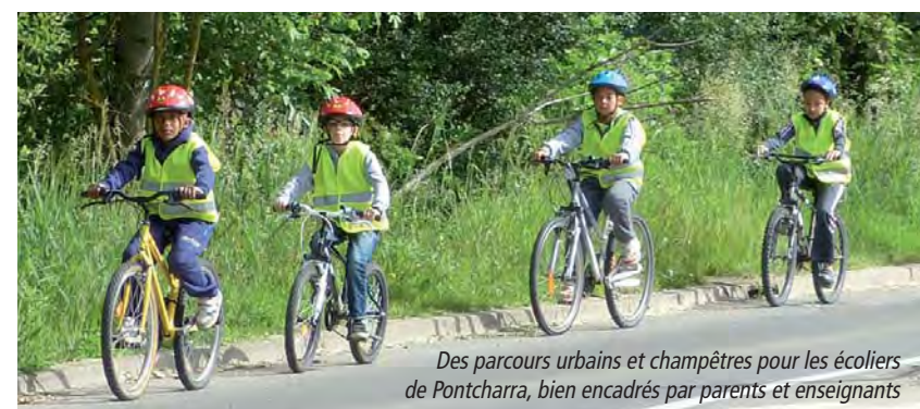
Des parcours urbains et champêtres pour les écoliers de Pontcharra, bien encadrés par parents et enseignants