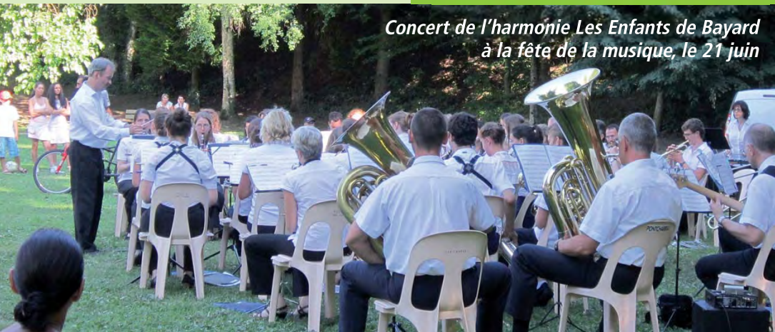
Concert de l'harmonie Les Enfants de Bayard à la fête de la musique, le 21 juin