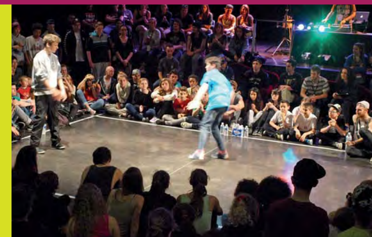
Ambiance assurée autour de chaque groupe de battle