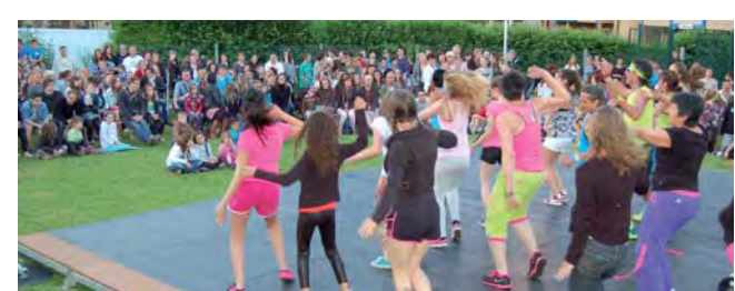
Les jeunes de Gaïa font le show