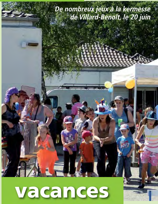
De nombreux jeux à la kermesse de Villard-Benoît, le 20 juin