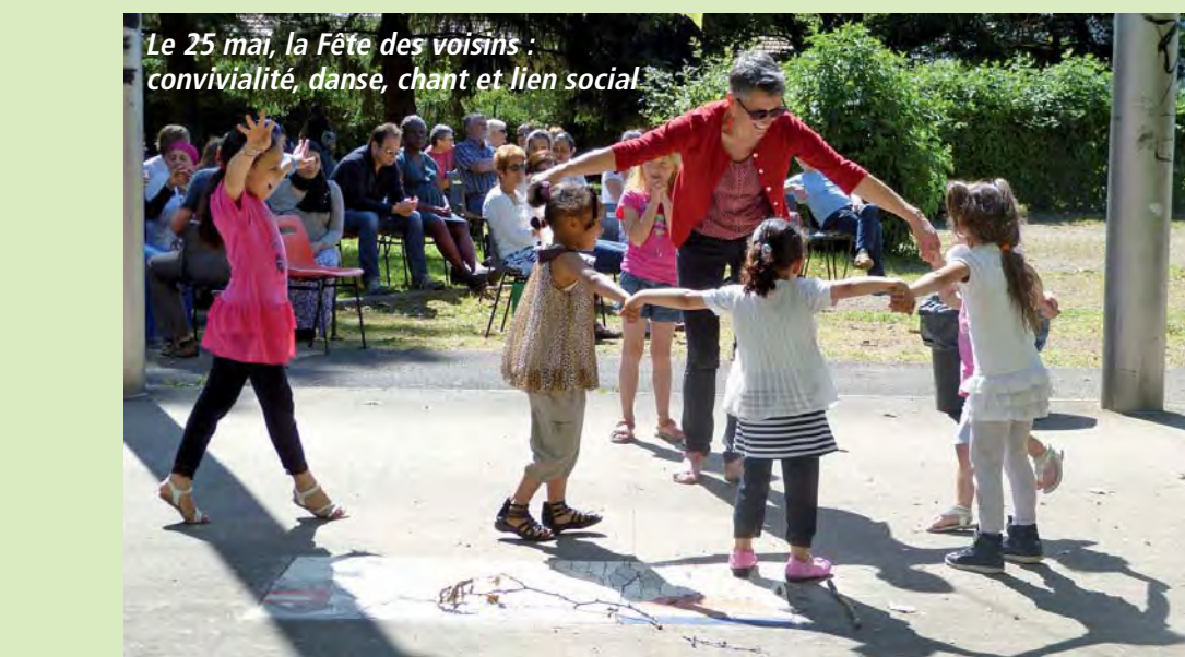
Le 25 mai, la Fête des voisins : convivialité, danse, chant et lien social