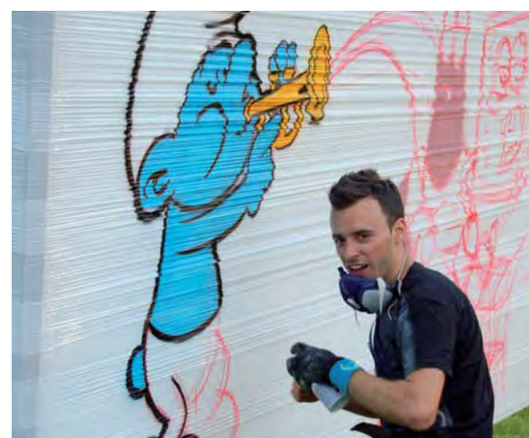
L'œuvre du graffeur Romain, réalisée sous l'œil des projecteurs et des spectateurs