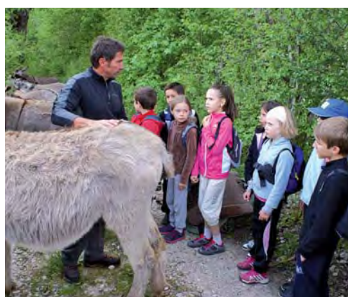
La classe verte de Villard-Noir à Saint-Agnan en Vercors, du 19 au 23 mai