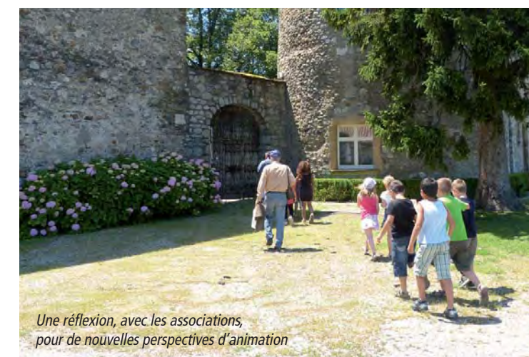
Une réflexion, avec les associations, pour de nouvelles perspectives d'animation