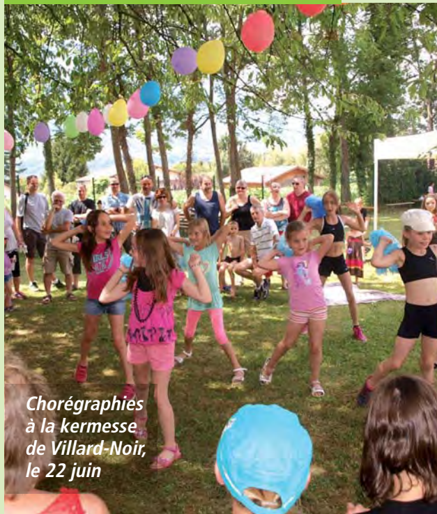
Chorégraphies à la kermesse de Villard-Noir, le 22 juin