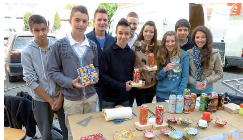
Sur le marché de Pontcharra, les lycéens ont proposé aux passants les produits de leur mini-entreprise