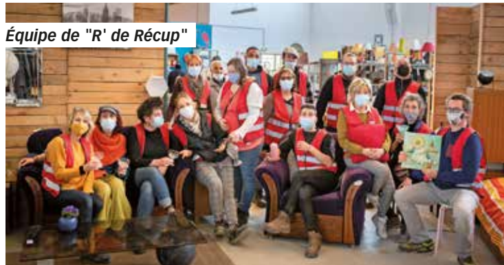
Équipe de "R' de Récup"

Pour changer durablement ses habitudes, il faut se mettre dans une nouvelle perspective. Alors que notre consommation s'inscrivait dans un processus linéaire : acheter, utiliser, jeter, aujourd'hui, on envisage la consommation comme un cercle vertueux : Réduire, Réutiliser, Recycler. Réduire, c'est donc bien diminuer sa consommation, réutiliser un maximum, réparer, déposer à la recyclerie "R'de Récup" ou revendre. Et enfin recycler, trier correctement ses déchets, composter... quand on n'a plus d'autre choix.