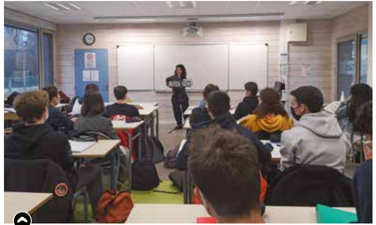
Le texte La migration des canards a été présenté aux élèves de quatre classes du collège Marcel Chêne et du lycée Pierre du Terrail.