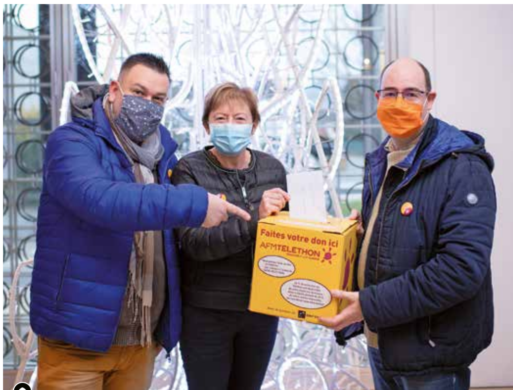
▶ Pontcharra/Saint-Maximin : le Téléthon 2020 a récolté 5 569,80 €