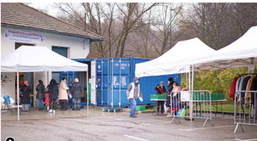
▶ Le Secours populaire se mobilise pour assurer ses actions de solidarité