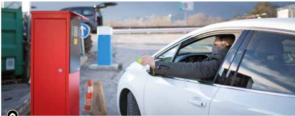
Une carte d'accès est obligatoire pour se rendre à la déchèterie