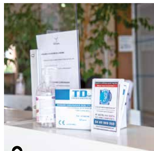
Maintien du budget consacré à la crise sanitaire