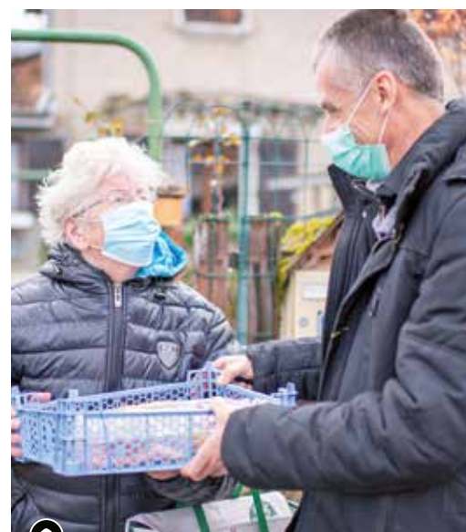
▶ Portage de repas de l'ADMR

Solidaires : Toujours et encore plus ! Les associations solidaires sont sur le pont pendant cette crise sanitaire ; faisant face à une augmentation des demandes. Dans ce contexte difficile, la municipalité adresse un grand merci et un grand bravo aux membres et bénévoles de ces associations, ainsi qu'à tous les habitants qui ont manifesté par un don, par une action ou même par un simple sourire leur soutien à cette chaîne de la solidarité.