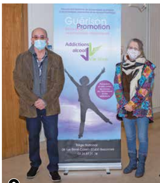
▶ Vie libre alcool et addictions. Numéro : 06 88 36 81 19

Solidaires : Toujours et encore plus ! Les associations solidaires sont sur le pont pendant cette crise sanitaire ; faisant face à une augmentation des demandes. Dans ce contexte difficile, la municipalité adresse un grand merci et un grand bravo aux membres et bénévoles de ces associations, ainsi qu'à tous les habitants qui ont manifesté par un don, par une action ou même par un simple sourire leur soutien à cette chaîne de la solidarité.