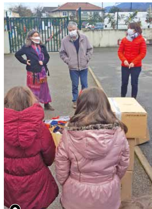
▶ À l'initiative de l'association Alpe, les enfants de l'école Villard-Benoît remettent des cadeaux aux associations