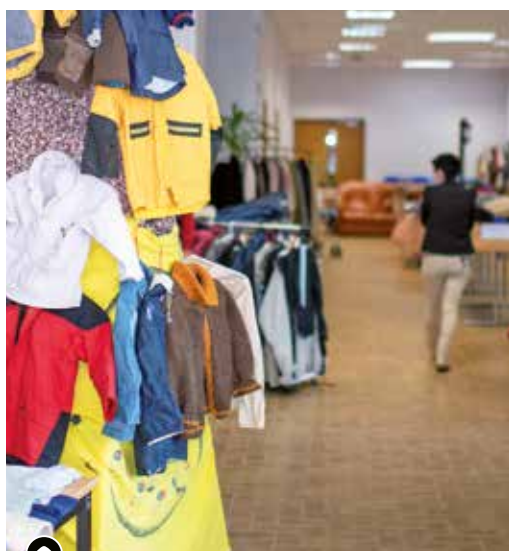
▶ Collecte vêtements hiver à l'église protestante