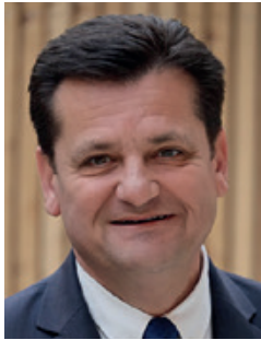
CHRISTOPHE BORG Maire

Notre équipe poursuivra les projets engagés qui structurent l'avenir de notre commune ainsi que de nouvelles ambitions. Le contexte dans lequel nous vivons actuellement renforce aussi nos convictions ; plus que jamais, notre quotidien se vit dans la préservation de l'environnement et du vivre-ensemble.