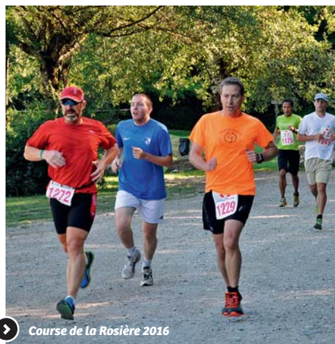
Course de la Rosière 2016

Inscriptions pour la course : www.athletisme-capr.fr