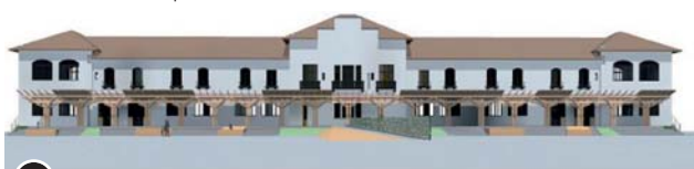
Vue du projet de la nouvelle école élémentaire César Terrier, rue des Écoles.

Premier groupe scolaire à entamer sa restructuration, le groupe élémentaire César Terrier commence par être réuni dans le bâtiment, dit César Terrier 2, rue des Écoles. Isolation, agrandissement, restructuration, équipements informatiques, etc. tous ces travaux seront effectués pour offrir aux usagers le confort nécessaire à ce lieu de travail et d'apprentissage. 4 salles de classe seront créées à l'étage. L'établissement sera complètement réhabilité et accueillera en septembre 2019, l'ensemble des classes élémentaires du groupe marquant la fermeture de l'école située rue des Alpes. Une bibliothèque centre documentaire, une salle d'arts plastiques, une salle de réunion/salle des maîtres sont intégrées au projet ainsi que l'accessibilité pour les personnes à mobilité réduite. Un préau sera créé.